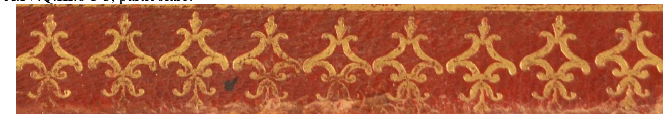
A.IV.Q.III.6 1-3, particolare.