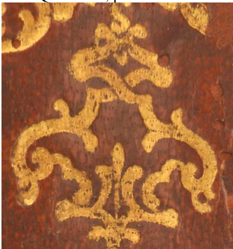
A.IV.Q.III.6 1-3, particolare.