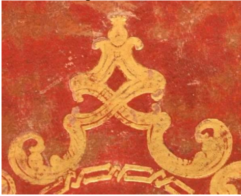
A.IV.Q.III.6 1-3, particolare.