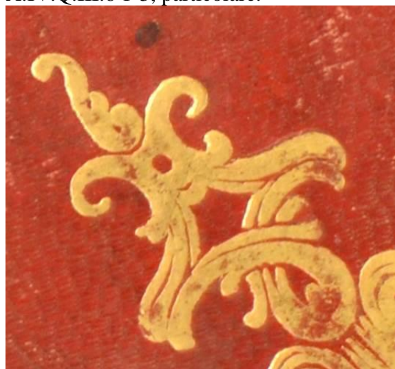
A.IV.Q.III.6 1-3, particolare.