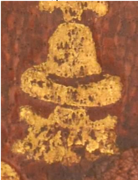
A.IV.Q.III.6 1-3, particolare.